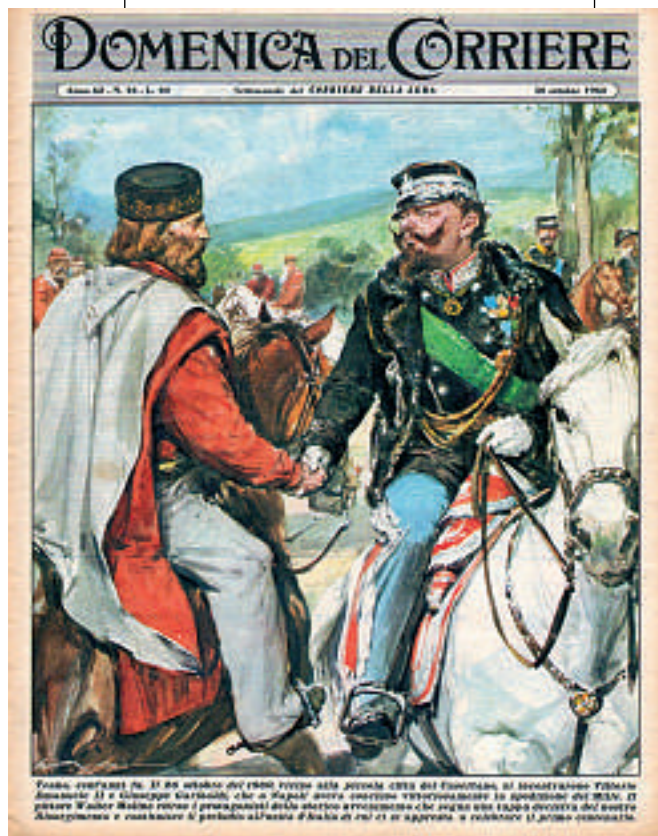
In un'edizione del primo numero della rivista "L'Unità" del 1861, si illustra l'Unità d'Italia. Il disegno raffigura, che a Napoli, dove esisteva l'indipendenza, la capitale del Regno. Il potere è nelle mani di un solo uomo, il re, che è il sovrano. Il potere è nelle mani di un solo uomo, il re, che è il sovrano. Il potere è nelle mani di un solo uomo, il re, che è il sovrano.

Coordinatore del Comitato per il Centocinquantenario Anniversario dell’Unità d’Italia Assessore alla Cultura e Pubblica Istruzione