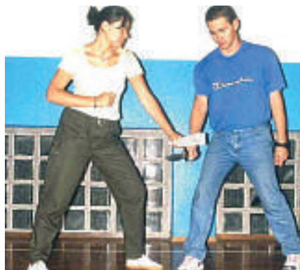
Lezione di difesa personale

In questi giorni, con rammarico, abbiamo raccolto il pianto di una madre, che si è rivolta a noi nella disperata ricerca di aiuto: si è resa conto di quale pericolo ha corso la figlia minore, avvicinata da uno sconosciuto malintenzionato, mentre, alle 7 del mattino, si recava a scuola. La vicenda è accaduta qualche settimana fa in un paese vicino al nostro. Una storia simile a quelle che si sentono, ormai troppo spesso, sui media: nel tragitto dall'abitazione alla scuola, la giovane è stata avvicinata da un adulto con intenzioni poco raccomandabili. Con il pretesto di chiedere che ora fosse, la giovane è stata fermata ed afferrata ad un braccio. Trattenuta con la forza, ha dovuto subire avance da parte dell'adulto. Al ritorno a casa, la figlia, ha raccontato l'accaduto ai genitori. Non forniremo ulteriori dettagli, in quanto ci sembrano fuori luogo e superflui. Postumi fisici pressoché nulli, traumi psicologici evidenti: tanto spavento da parte della giovane e dei suoi cari. Con il senno di poi è andata ancora bene così. Difatti con un epilogo peggiore ne sono piene le cronache. Vorremmo, invece, solo soffermarci sull'accaduto per riflettere. Il nostro rammarico è nel constatare che dopo 17 anni di attività sul territorio (il primo corso a Carugate risale al 1994, organizzato in collaborazione