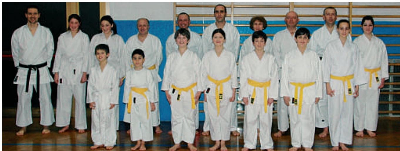
Alcuni allievi del corso di Karate 2010/11

gli è capitato qualche brutto episodio e che ci chiedano di insegnare loro una qualche "tecnica segreta" (modello film o cartone animato) in modo che se si dovesse ripresentare il problema i figli sappiano "difendersi". Difficile far capire che di "tecniche segrete" non ce ne sono. C'è solo da dedicare del tempo e lavorare su se stessi con una finalità, quella di affrontare il problema e cercare di prepararsi al meglio a gestire una situazione potenzialmente pericolosa che mai avremmo voluto ci si presentasse davanti. Ecco il corso di difesa personale, con docenti qualificati ed abilitati dalla Regione Lombardia all'insegnamento di questa materia così delicata e complessa, per i molti risvolti (psicologici, legali e sociali per citarne solo alcuni) che si porta con sé. Non si vuole fare terrorismo psicologico, o diffondere paura e panico. Ma neanche nascondendo la testa sotto terra aiuta a risolvere il problema. Bisogna dare il giusto peso alla cosa, contestualizzandola nella nostra realtà. Il CDP si ritrova presso la palestra della scuola elementare di via Roma (ingresso da via Sant'Andrea) il martedì dalle ore 18.30 alle 21.00. Per informazioni sui corsi di Karate e Difesa Personale contattarci in palestra o ai seguenti recapiti: e-mail: okinawakan@yahoo.it, cell. 338/2635467.